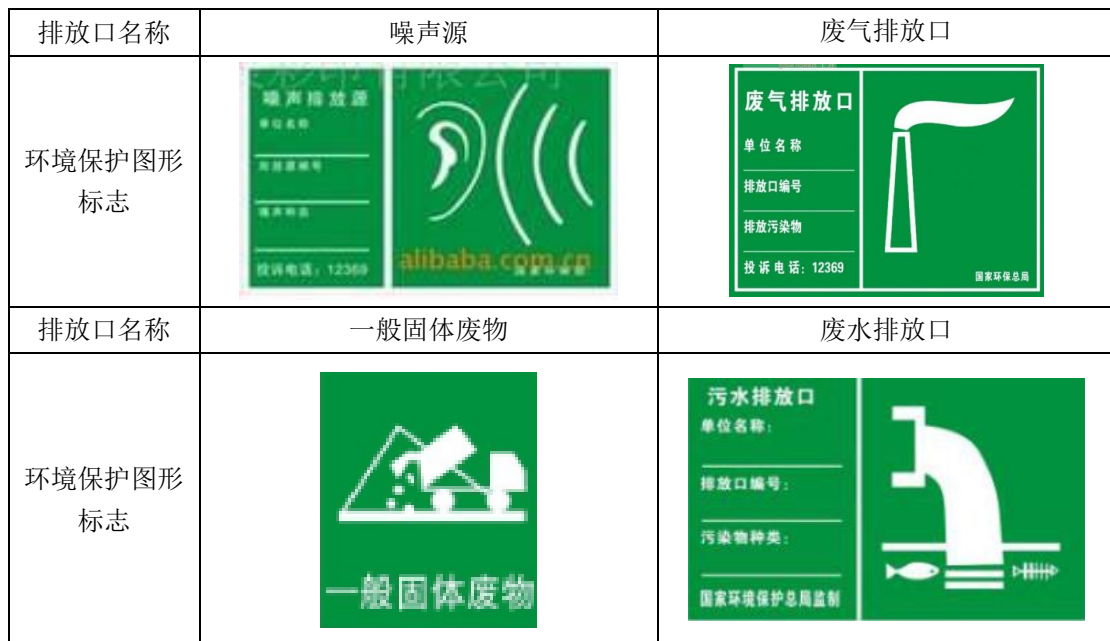
表 7-14 各排污口环境保护图形标志