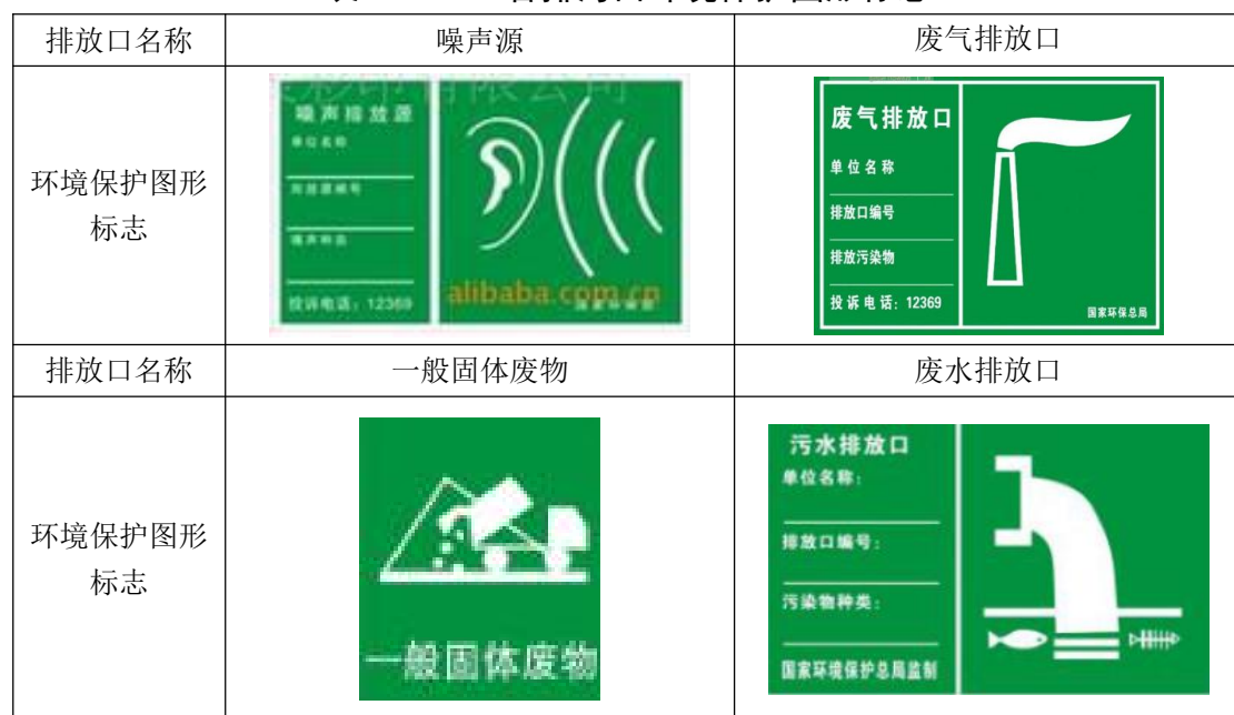
表 7-25 各排污口环境保护图形标志