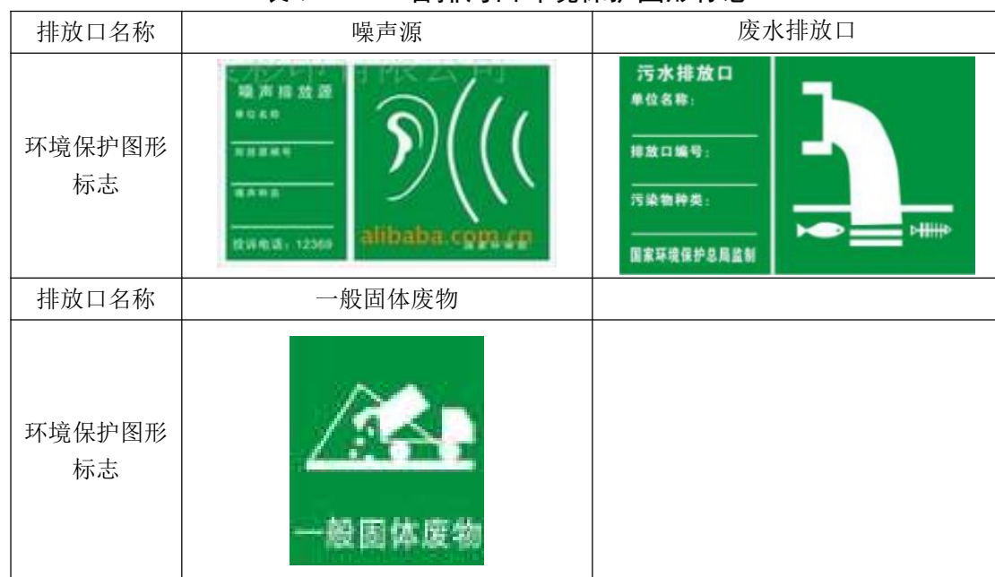
表 7-14 各排污口环境保护图形标志