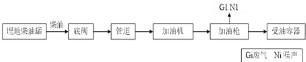
图 3 项目柴油加油工艺流程图及主要排污节点

注：项目油罐的清洗作业由具备该资质的专业公司负责清洗，废油渣由该清洁单位清洗完成