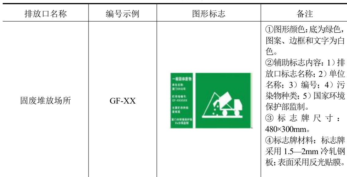
表 29 排放口标识牌示例