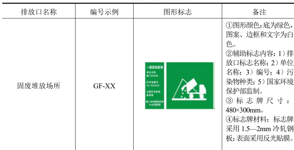
表 28 排放口标识牌示例